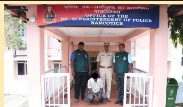
सुदृढ़ता मिली है।

श्री विजय पुरम, 1 अप्रैल मादक पदार्थों के विरुद्ध अपनी निरंतर सख्त कार्रवाई को जारी रखते हुए, अण्डमान तथा निकोबार पुलिस के एंटी-नारकोटिक्स पुलिस थाना (एनपीएस) ने बैकवर्ड एवं फॉरवर्ड लिंकज पर प्रभावी प्रहार करते हुए एक महत्वपूर्ण सह-आरोपी को गिरफ्तार किया है, जिससे मादक पदार्थों के नेटवर्क को ध्वस्त करने के प्रयासों को और मजबूती मिली है।