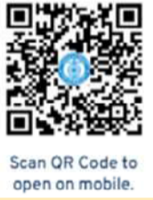
Scan QR Code to open on mobile.

श्री विजय पुरम, 1 अप्रैल अण्डमान तथा निकोबार प्रशासन के पर्यटन निदेशालय द्वारा लिटिल अण्डमान में 9 से 12 अप्रैल, 2026 तक सर्फिंग महोत्सव का आयोजन किया जा रहा है। इस महोत्सव का उद्देश्य द्वीपों को जल क्रीड़ा और साहसिक पर्यटन के प्रमुख स्थल के रूप में बढ़ावा देना है। इस कार्यक्रम में राष्ट्रीय और अंतरराष्ट्रीय सर्फर्स के साथ-साथ पर्यटक, स्थानीय उत्साही और प्रशासनिक अधिकारियों की भागीदारी की संभावना है। इस संबंध में, जहाजराणी सेवा निदेशालय ने लिटिल अण्डमान के लिए जहाज एमवी नालंदा की विशेष यात्रा व्यवस्था की है, ताकि सर्फिंग में भाग लेने वाले सर्फर्स, पर्यटक, आम जनता और सरकारी अधिकारी आसानी से यात्रा कर सकें। यात्राओं का संचालन निम्नलिखित कार्यक्रम के अनुसार किया जाएगा: